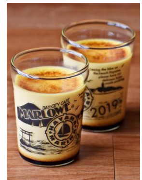
葉山マリーナオリジナルデザインのビーカー